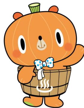
金山町公式キャラクター かぼまる

寄付をしていただいた方には、返礼品として金山町の特産品をお贈りしています。奥会津金山天然炭酸の水や金山町産米、特産品セットなど、ぜひお楽しみください。