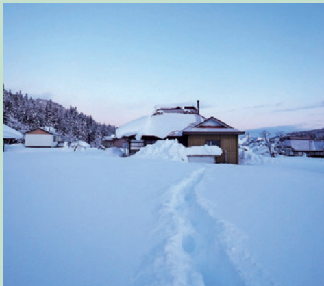
白銀に包まれる「みみをすます」

補助金は、主に寒さ対策のための断熱材とキッチンの改修に活用させていただきました。民泊の空間を整えられたことで、お客様をもてなす基盤ができた