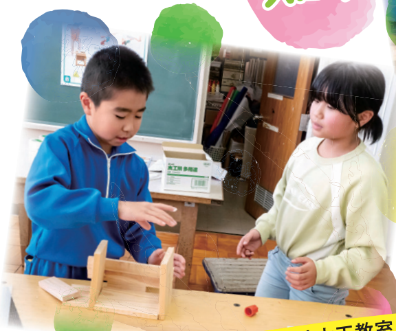
かねやま小学校木工教室