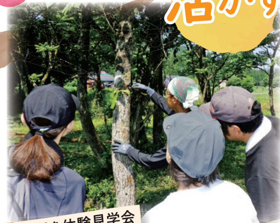
漆掻き体験見学会