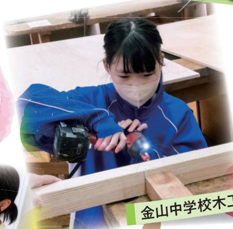
金山中学校木工教室