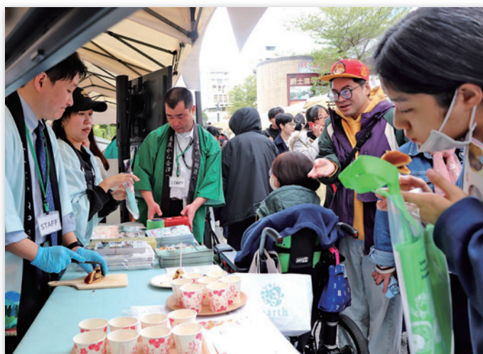
甘酒や栗どら焼きなどを堪能

1月23日～27日、 きんざんく 金山區、 たいべい 台北周辺で台湾プロモーションが行われました。台北メトロシアターでのあいせき列車只見線の上映を始めに、町の映像放映、金山名物の振る舞いや赤べこ絵付け体験によるPR活動を行いました。最終日は金山區で映画3部作の特別上映とおにぎり・なめこ汁の振る舞いが行われ、「金山のお米は美味しい」「ぜひ金山に来訪したい」と楽しい交流となりました。今回は福島県や近隣町村との合同開催となり、より効果的なプロモーションとなりました。