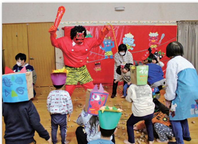
怖くても果敢に立ち向かう子どもたち