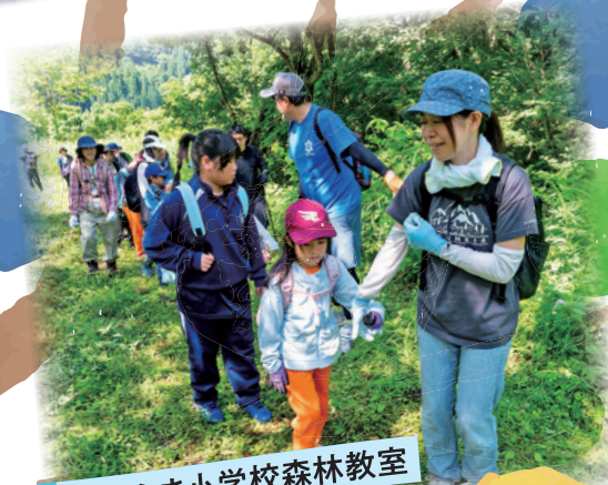
かねやま小学校森林教室