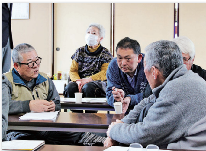
今後の地域づくりを考える貴重な時間になりました