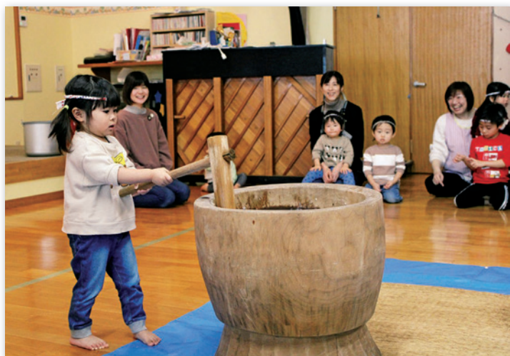
「美味しくなあれ」と気持ちを込めて