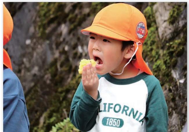
大きな一口でいただきます！

このさつまいもは子どもたちが育て、掘り起こしたさつまいもで、皆美味しく育ったことを喜びながらおなかいっぱい食べていました。