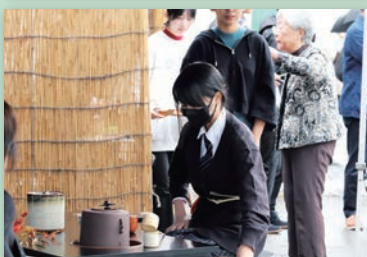
川高生も頑張っていました