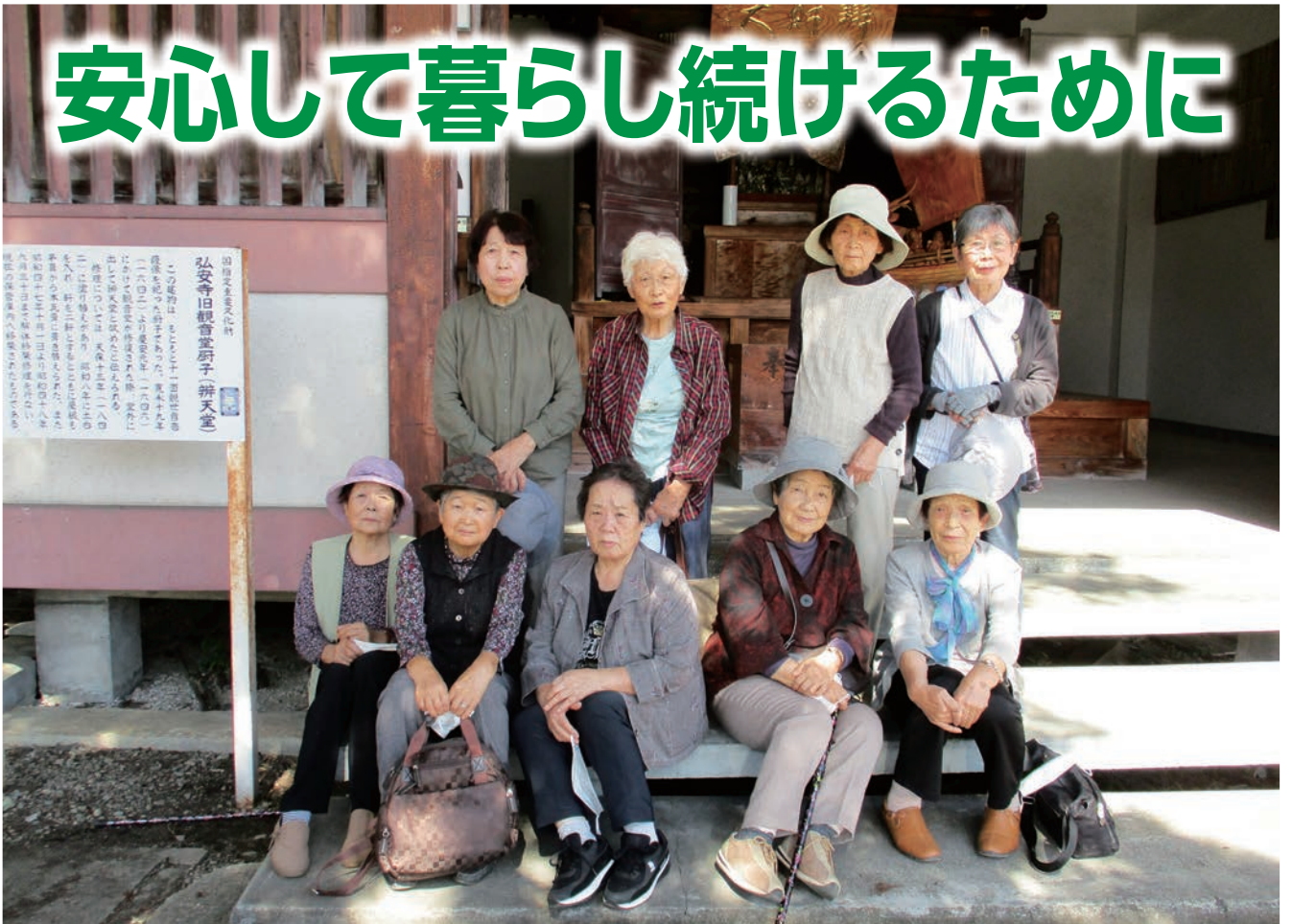
いきいき生活倶楽部（中川遠足）

住み慣れた地域でいつまでも安心して暮らし続けるために、高齢者の方に向けた様々な制度を実施しています。今回は、在宅で暮らしている方が利用できる介護保険制度と、新たに開始した金山町独自の支援事業をご紹介します。