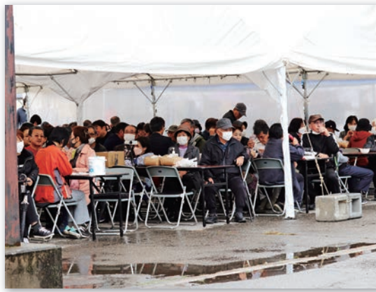
ステージ企画やごっつおを楽しむ来場者