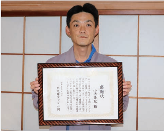
活動の継続に力を入れる小池さん