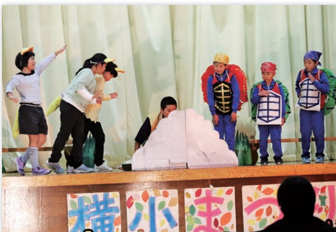
煙に包まれる浦島太郎（中央）