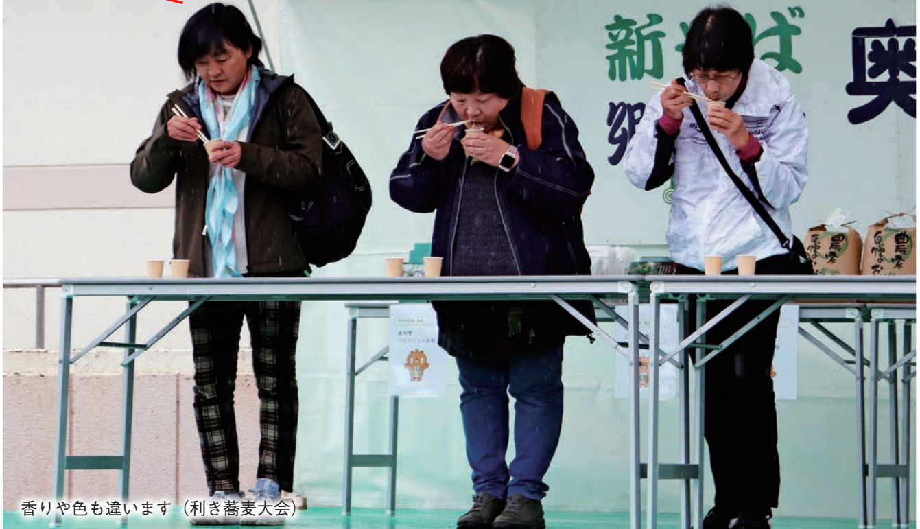
香りや色も違います (利き蕎麦大会)