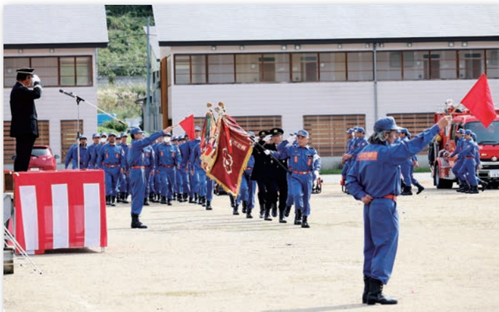
統制が取れた分列行進