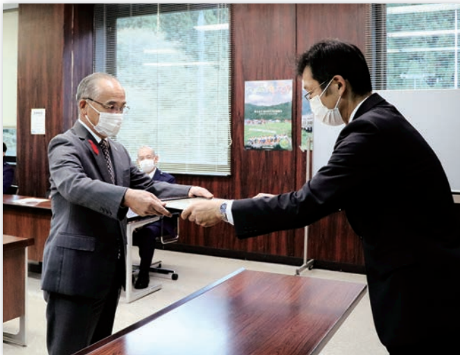
表彰状を受け取る押部町長