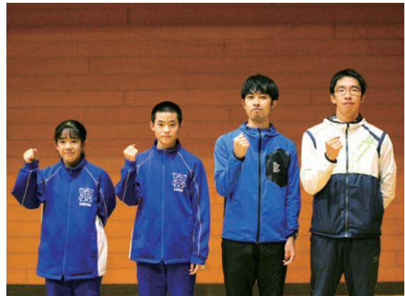
ベストを尽くして頑張ります