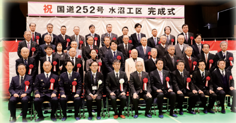
完成式での集合写真