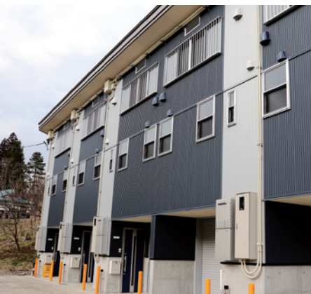
上ノ在池の新住宅