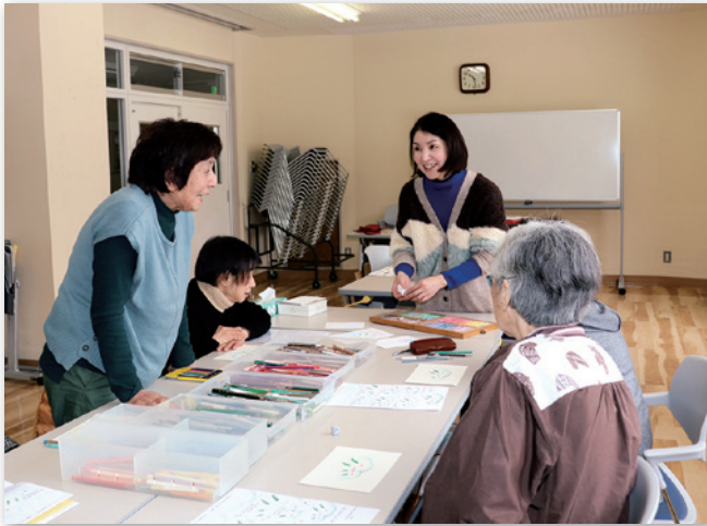
楽しく活動をする参加者の皆さん