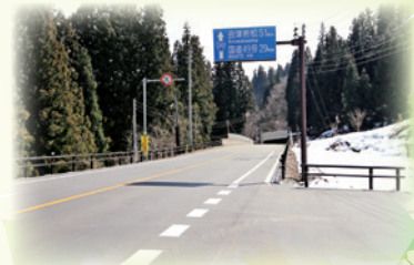
待避所もあります

3月25日に国道252号水沼工区完成式が行われました。新潟・福島集中豪雨時に道路が冠水し大きな迂回が生じたことから、災害に強い道路が求められ、平成26年度から整備が進められてきました。JR只見線と只見川に挟まれ限られた範囲の中で施工を行い、一般交通を確保しながら車線を切り替え、段階的に現道をかさ上げしてきました。この整備により、浸水被害を受けにくい道路になり、同時に冬期も安全に走行ができるようになったことから、安心安全な日常生活が送れます。円滑な道路が確保され、地域間の道路機能強化及び救急医療機関へのアクセス向上、会津地方の更なる地域振興が図られると期待されています。