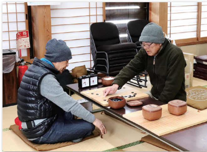
一手一手に緊張が走ります

3月17日、川口集会所において金山棋苑主催の囲碁・将棋大会が行われました。将棋4名、囲碁7名で行われた大会は、指す音が響く静かな大会でしたが、参加者はみな、緊張した面持ちで一手一手を指していました。