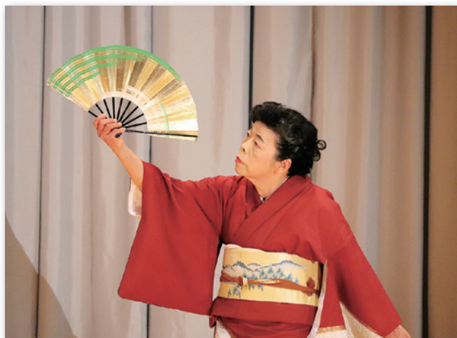
滑らかな踊りに注目が集まります

発表会は、謡曲、舞踊、昔語り、カラオケなど様々で、発表会に参加した方々は日頃の鍛錬の成果を楽しみながら発表していました。