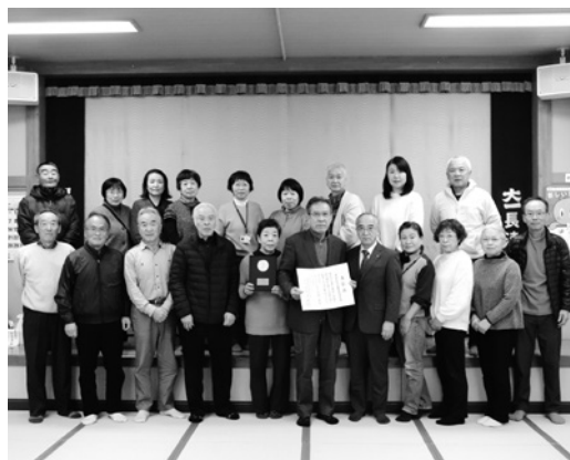
表彰された民生委員の皆さん