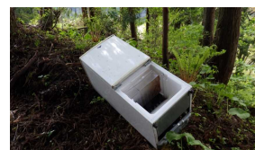
実際に捨てられていたごみ

不法投棄は地域の景観を損ねるだけでなく、土壌や河川の汚染につながることもあります。もし不法投棄を見つけた際にはすぐに保健係へご連絡ください。