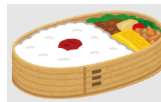
曲げわっぱのイメージです。