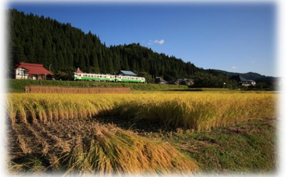
にほんの里100選 秋の中川集落

金山町では、先人が守り育て、我々に託してくれた豊かな自然環境や地域資源、伝統文化を後世に伝えながら、これらを積極的に活用した町づくりを進めるために寄附金を募集しています。どうぞ、「ふるさと納税制度」を御活用いただき、ふるさと金山町へ応援をお願いします。