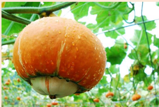
金山町特産品の赤カボチャ

町の東部には沼沢火山の噴火によって出来たカルデラ湖「沼沢湖」が四季折々に神秘的な景観をみせてくれます。金山町の大塩地区では、全国でもめずらしい天然の炭酸水が湧き出ており、「金山町の天然炭酸水」として全国で販売されています。また、美容と健康に良いといわれる炭酸が含まれる温泉が町内に多数存在しており、多くの方にご利用いただいています。さらに、ほくほくと栗のようにあまいかぼちゃ「奥会津金山赤カボチャ」が有名です。ぜひ一度、金山町にお越しください。