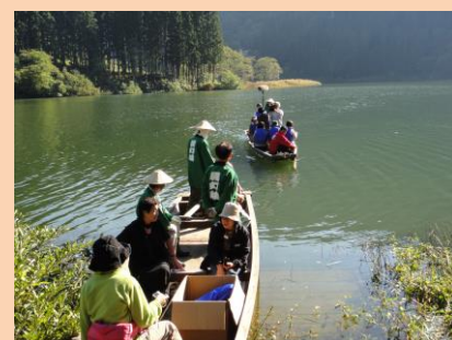
霧幻峡プロジェクト（三更地区）

少子・高齢化が進みそれぞれの集落の維持・存続が困難な集落が増えています。しかし、町内には、まだまだ“金山をあきらめない”という強い意志を持って新たに地域おこしを行おうとするグループも出て来ています。これらの地域活性化を積極的に進めるため、地域産業の育成支援事業、伝統文化の継承事業等を行い、地域の活性化を進めます。このような活動のほか、農業・観光等で金山町の活性化につながる事業など金山町が活性化する事業の推進を図ります。