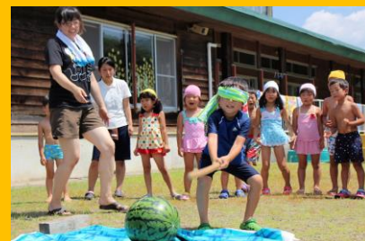
町の宝 大切な子どもたち

金山町の将来を担う子供たちを取り巻く環境の充実を図ります。金山町でも少子化が進んでおり、平成25年度には「金山町少子化対策推進条例」が制定され、少子化対策に力を入れています。現在、保育料の無料化、義務教育の給食無料化、子どもたちへのあらゆる学習機会の提供などのほか、住環境の整備、若者の定住促進、結婚対策事業などあらゆる分野において総合的に少子化対策に取り組んでいます。