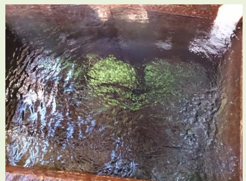
大塩地区の井戸から湧く炭酸水